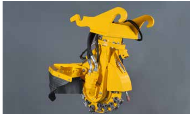
SCE-550H met verachttert snelwissel CW 20-40 voor 80 l/min

De SCE-550H is de middelste stobbenfrees uit deze serie. Deze uitvoering is geschikt voor de meeste kranen tussen de 7 en 14 ton. De SCE-550H is uitgevoerd met een freeswiel met een diameter van 55 cm (64 cm met beitels). De machine heeft een hydraulische motor met een oliestroom tussen de 60 en 80 L/min (max 350 Bar).