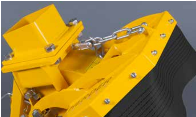
Mechanische verstelbare spanenkap bij de SCE-410H (standaard)

De SCE-410H is standaard uitgevoerd met een mechanisch verstelbare spanenkap. Optioneel kan de SCE-410H uitgevoerd worden met een hydraulisch verstelbare spanenkap, de SCE-550H, de SCE-630H en de SCE-800H daarentegen zijn standaard uitgevoerd met een hydraulisch verstelbare spanenkap. Hierdoor kunt u - als gebruiker - vanuit de cabine van uw hydraulische graafmachine de spanenkap zo positioneren dat altijd maximale veiligheid en afscherming gegarandeerd is.