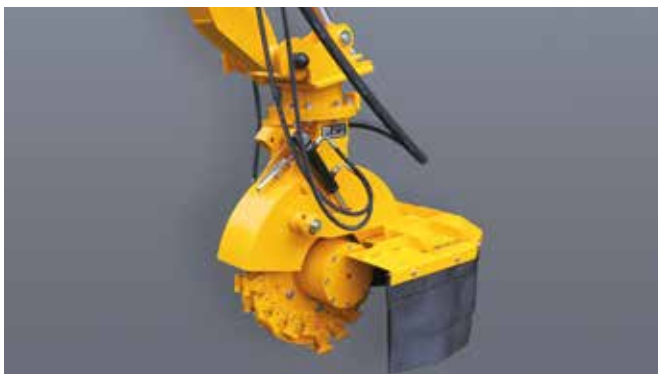
SCE-630H in basisuitvoering voor max. oliestroom van 110 of 150 l/min

De SCE-630H is de middelste stobbenfrees uit deze serie. Deze uitvoering is geschikt voor de meeste kranen tussen de 10 en 20 ton. De SCE-630H is uitgevoerd met een freeswiel met een diameter van 63 cm (72 cm met beitels). U heeft de keuze uit twee hydraulische motoren. Zo kunt u kiezen uit een motor voor een oliestroom tussen de 80 en 110 L/min (max 350 Bar) of tussen de 110 en 150 L/min (max 350 Bar).