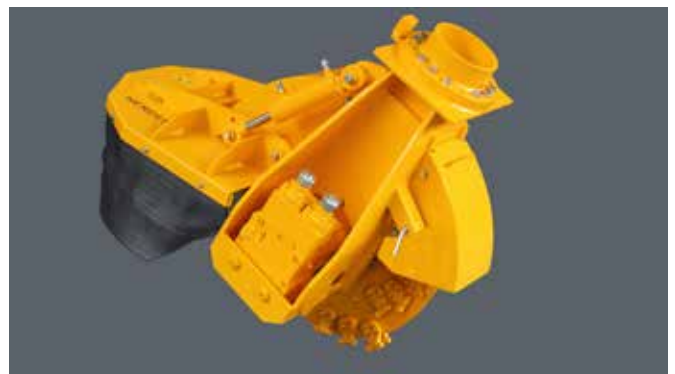
SCE-800H in basisuitvoering voor oliestroom tussen 80 en 160 l/min

De SCE-800H is de grootste stobbenfrees uit deze serie. De SCE-800H is uitgerust met een freeswiel met een diameter van 80 cm (89 cm met beitels). Deze Herder-Fermex wordt standaard geleverd met een mechanisch verstelbare hydraulische motor. Daarmee is deze stobbenfrees geschikt voor elke hydraulische kraan met een oliestroom tussen de 80 en 160 L/min (max. 420 Bar) en te gebruiken voor de meeste kranen tussen de 10 en 20 ton.