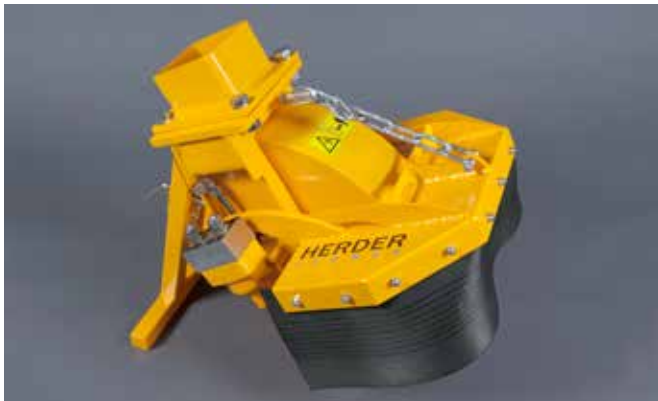
SCE-410H in basisuitvoering voor max. oliestroom van 40 of 50 l/min

De SCE-410H is de kleine stobbenfrees uit deze serie. Deze uitvoering is geschikt voor de meeste kranen tussen de 3 en 8 ton. De SCE-410H is uitgevoerd met een freeswiel met een diameter van 41 cm (50 cm met beitels). U heeft de keuze uit twee hydraulische motoren. Zo kunt u kiezen uit een motor voor een oliestroom tussen de 30 en 40 L/min (max 350 Bar) of tussen de 40 en 50 L/min (max 350 Bar).