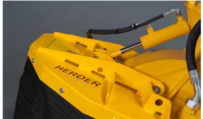
Hydraulisch verstelbare spanenkap bij de SCE-550H, SCE-630H en SCE-800H (standaard)