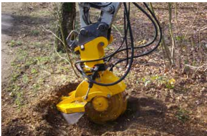
Hydraulische opklapbare spanenkap bij de SCE-410H (optioneel)